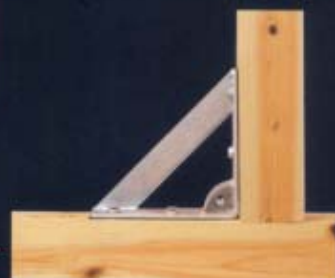
ボルイン・ワン本体の接続補強