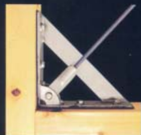
梁と柱をボルイン・ワンとプレス用金物で補強