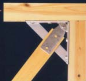
ボルイン・ワンと木プレス用金物で補強