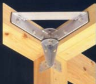
ボルイン・ワンと連結用金物で梁と柱を強固に固定